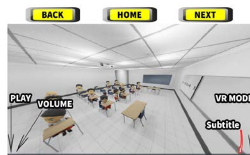
Gambar 2. Pengaturan pada Media VRiDAS-SMART