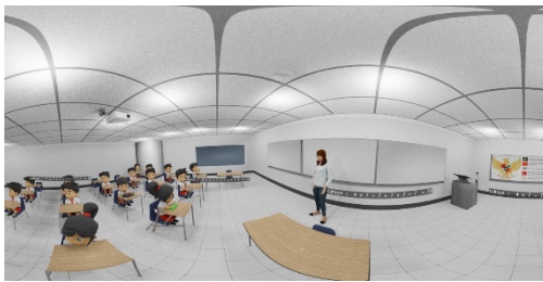
Gambar 3. Suasana Kelas pada Media VRiDAS-SMART