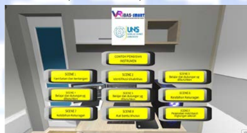
Gambar 1. Tampilan menu pada media VRiDAS-SMART

mahasiswa PLB di kelas inklusif (3 tunanetra, 3 tunarungu, dan 9 non-disabilitas). Partisipan penelitian merupakan mahasiswa program studi PLB UNS yang sedang menempuh mata kuliah Identifikasi dan Asesmen bagi ABK. Teknik pengumpulan data dilakukan dengan menggunakan tes pilihan ganda untuk mengukur pemahaman mahasiswa tentang materi penyusunan PBS. Pengukuran dilakukan sebanyak dua kali, yaitu sebelum ( pretest ) dan sesudah ( posttest ) pemberian VRi-DAS. Data yang berhasil dikumpulkan selanjutnya dianalisis menggunakan teknik analisis paired sample t-test . Berikut ini disajikan beberapa tangkap layar aplikasi VRiDAS-SMART pada Gambar 1, Gambar 2, dan Gambar 3.