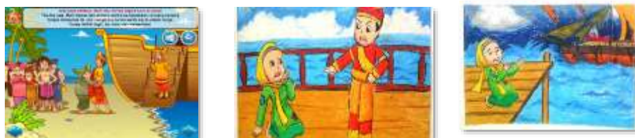
Gambar 2. Contoh Gambar Berseri tentang Malin Kundang

Media gambar berseri ini digunakan pada pertemuan kedua, dengan tujuan untuk mempermudah siswa dalam menentukan kata kerja yang akan mereka gunakan dalam tulisan mereka. Oleh karena itu gambar disajikan sudah dalam 1 rangkaian utuh. Adapun langkah-langkah penggunaan media gambar berseri adalah sebagai berikut: