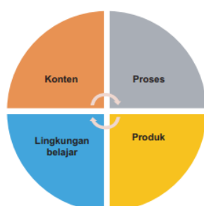
Gambar 2. Aspek Pembelajaran Berdiferensiasi

Selain itu, pentingnya pembelajaran berdiferensiasi diterapkan karena memiliki keunggulan berupa empat aspek yang dapat dikontrol oleh guru dalam pemetaan sesuai kebutuhan belajar siswa (Fitria, 2022). Pertama konten , materi yang disajikan lebih bervariasi, menggunakan kontrak belajar, menyuguhkan dengan berbagai moda pembelajaran, dan beragam sistem pendukung. Kedua proses , kegiatan yang dilakukan siswa di kelas dengan baik dan tingkat kesulitan belajar yang berbeda dari kesiapan, minat, dan profil belajar. Ketiga produk , guru merancang produk yang dikerjakan oleh siswa disesuaikan berdasarkan pengetahuan dan keterampilan yang mencerminkan pemahaman mereka “ consumer of knowledge to producer with knowledge ”. Keempat lingkungan belajar , suasana berupa fisik dan psikis yang menyenangkan, aman, nyaman, dan tenang dalam belajar. Hal ini diperkuat oleh penelitian Kamal (2022), bahwa terdapat peningkatan hasil belajar karena pengaruh penerapan pembelajaran berdiferensiasi.