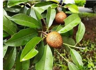
(E) Manilkara kauki