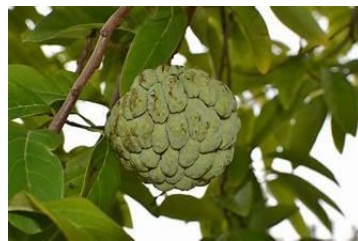
(D) Annona squamosa