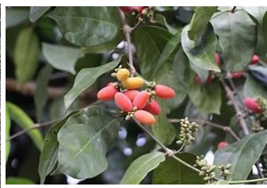
(G) Gnetum gnemon