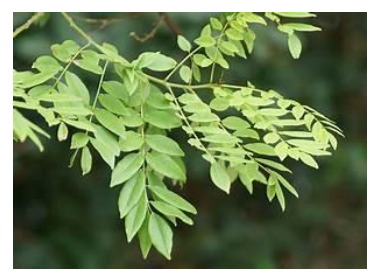
(H) Gliricidia sepium