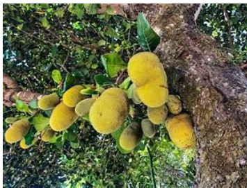
(F) Artocarpus heterophyllus