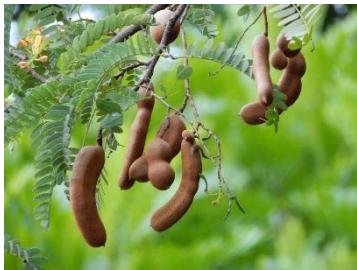
(A) Tamarindus indica

Monyet Ekor Panjang ( Macaca fascicularis ) (Gambar 2). Asem ( Tamarindus indica ) dimanfaatkan terutama pada bagian buah dan daun muda yang mengandung karbohidrat dan memiliki cita rasa asam-manis, sehingga menjadi sumber 71rimat penting. Jambu biji ( Psidium guajava ) dimanfaatkan bagian buahnya yang kaya air dan nutrisi, sedangkan daun muda berperan sebagai pakan tambahan. Sirsak ( Annona muricata ) dan srikaya ( Annona squamosa ) menghasilkan buah berdaging lunak dengan kandungan nutrisi tinggi yang mudah dicerna, sehingga sering dikonsumsi oleh Monyet Ekor Panjang. Selain itu, sawo bludug ( Manilkara kauki ) juga berpotensi sebagai pakan karena buahnya memiliki tekstur lunak dan kandungan gula alami. Preferensi monyet ekor panjang terhadap buah berdaging lunak dan daun muda telah banyak dilaporkan dalam berbagai penelitian primata tropis (Kusuma et al. , 2023).