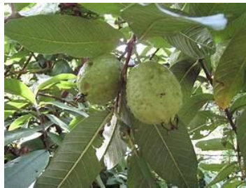
(B) Psidium guajava