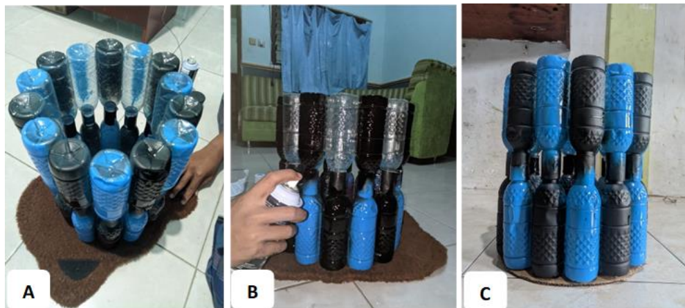
Gambar 2. Tahapan pembuatan tempat sampah dari botol plastik bekas: (a) penataan botol plastik bekas, (b) pengecatan botol plastik, dan (c) tempat sampah yang selesai dibuat.

Gambar 2 berikut menampilkan transformasi botol plastik bekas pakai menjadi tempat sampah.