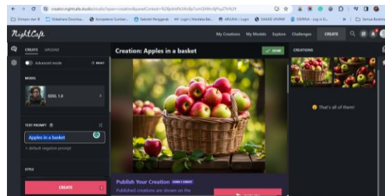
Gambar 1. Tampilan hasil gambar menggunakan Nightcafe

klik tombol “Create” atau “Generate”, maka otomatis akan muncul gambar seperti di bawah ini.