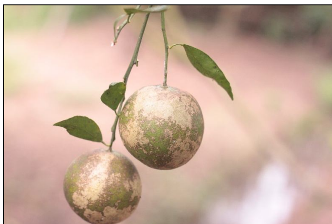
Gambar 7. Gejala serangan Kutu Daun/Thrips.

Kutu Daun. Scirtothrips citri Moulton adalah salah satu spesies kutu daun penting yang menjadi hama utama pada tanaman jeruk dan beberapa tanaman hortikultura lainnya. Hama ini terutama merusak jaringan muda tanaman dan menyebabkan kelainan pertumbuhan serta cacat pada buah (Natalia et al., 2019). S. citri dewasa berukuran sangat kecil, sekitar 0,8–1,2 mm, tubuh berwarna kuning-oranye atau oranye pucat, sayap sempit dengan rambut halus ( fringed wings ), ciri khas Thysanoptera , antena terdiri dari 8 segmen, tarsus satu segmen dengan ujung cakar berbentuk kait kecil. Nimfa berwarna kuning muda hingga jingga, tidak bersayap, umumnya ditemukan pada pucuk muda dan permukaan buah yang masih lunak. Telur diletakkan secara tersembunyi di jaringan daun muda atau permukaan buah, berukuran sangat kecil, berwarna putih hingga transparan (Shogren, 2017). Bagian tanaman yang diserang adalah pucuk muda, daun muda, dan buah muda (stadium awal pertumbuhan). Kutu daun menggunakan alat mulut bertipe menggores-mengisap untuk merusak epidermis jaringan muda. Kerusakan terjadi karena sel epidermal dikosongkan, menyebabkan timbulnya jaringan parut, warna perak ( silvering ), serta munculnya parut melingkar pada buah ( ring scar ). Serangan pada daun mengakibatkan daun muda terdistorsi atau keriting, ujung pucuk menghitam atau tampak seperti terbakar (Morse & Hoddle, 2006)