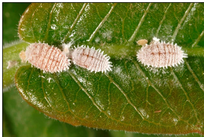
Gambar 3. Imago Planococcus citri .

Kutu Putih. Kutu putih (famili Pseudococcidae ) merupakan kelompok serangga Hemiptera yang banyak menyerang tanaman jeruk. Beberapa spesies penting pada jeruk meliputi Planococcus citri , Ferrisia virgata , dan Dysmicoccus brevipes . Hama kutu putih yang ditemukan dalam penelitian ini adalah P. citri . P. citri adalah spesies yang paling sering dilaporkan sebagai hama utama jeruk (Bentley & Coviello, 2012). Imago betina berbentuk oval, lunak. Warna tubuh putih hingga kekuningan, tertutup lapisan lilin seperti tepung, memiliki mealy wax filaments di tepi tubuh. Panjang tubuh 2 – 4 mm, tidak bersayap. Betina dewasa memiliki kapsul telur berbentuk gumpalan kapas ( ovisac ), imago jantan bertubuh lebih kecil, bersayap satu pasang, memiliki siklus hidup singkat berkisar antara 1–2 hari, dan hanya berfungsi untuk kawin. Nimfa Berwarna kuning pucat, instar awal ( crawlers ) memiliki mobilitas tinggi. Lilin putih yang menutupi tubuh mealybugs berfungsi melindungi dari predator dan insektisida (Asiedu et al., 2014).