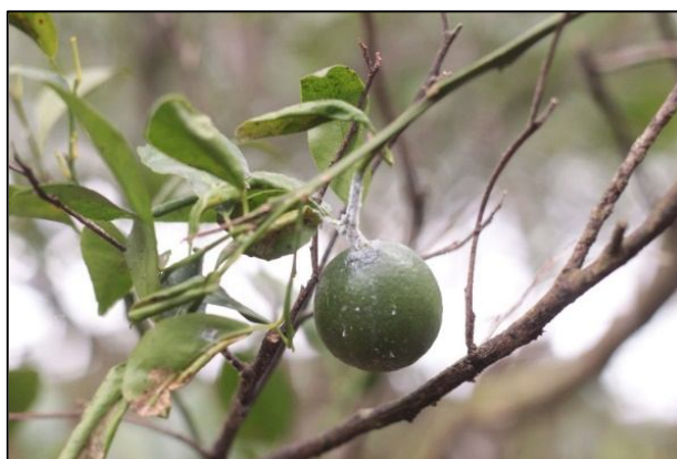
Gambar 4. Gejala Serangan Planococcus citri .

terhambat (Cid & Fereres, 2010). P. citri menghasilkan embun madu (honeydew) yang menjadi substrat jamur jelaga ( Capnodium sp. ). Keberadaan P. citri menyebabkan deformasi daun, klorosis, kerontokan, dan mengurangi kualitas buah, terutama pada kultivar jeruk manis dan jeruk siam sehingga menurunkan daya jual buah (Santa-Cecilia et al., 2018). Dampak serangan kutu putih yang didapat dari pengamatan lapang adalah adanya koloni berwarna putih seperti kapas, buah tampak lengket, daun menghitam akibat jelaga serta mengakibatkan tanaman kerdil (Gill et al., 2012).