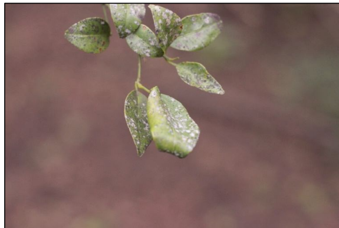
Gambar 2. Gejala Serangan kutu daun.