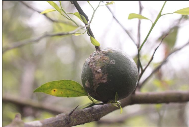
Gambar 13. Gejala infeksi Kudis Jeruk.

Gejala serangan kudis jeruk dapat diamati pada batang, cabang, daun, dan buah adalah munculnya luka berbentuk cekungan atau tonjolan seperti kerak (kanker), luka berwarna coklat kehitaman, sering disertai gummosis (pengeluaran getah), daun di sekitar luka bisa menguning dan rontok (Ningsih et al., 2022). Luka kecil muncul di permukaan kulit buah, membentuk bercak kasar, bercak bisa membesar dan menyebabkan buah cacat atau jatuh prematur (Puspitasari & Siagian, 2021).