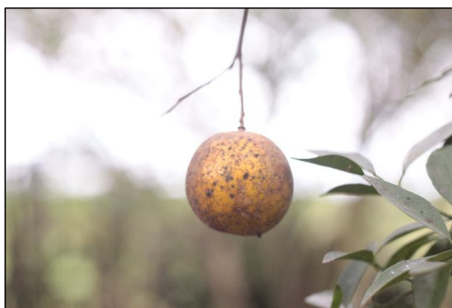
Gambar 6. Gejala serangan Tungau.

banyak tunas muda tersedia. D. citri mengisap getah/floem pada tunas dan daun muda dan memilih tunas dan daun muda untuk makan dan bertelur. Aktivitas mengisap ini menyebabkan tunas menjadi keriting, terdistorsi, dan pertumbuhan terhambat; daun muda dapat mengalami klorosis dan deformasi (Wijaya et al., 2017). D. citri adalah vektor utama bakteri penyebab Huanglongbing (HLB), juga disebut Citrus Greening atau dalam istilah lama CVPD; baik nimfa maupun dewasa dapat menularkan Candidatus Liberibacter spp. ke pohon sehat saat mengisap (Aubert, 1992). Karena itu, serangan kutu loncat tidak hanya merusak langsung tetapi juga berpotensi menyebabkan penyakit sistemik yang jauh lebih merusak.