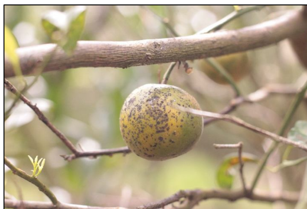
Gambar 5. Gejala serangan Kutu Loncat.

Kutu Loncat. Kutu loncat tanaman jeruk ( Diaphorina citri ), termasuk dalam Ordo Hemiptera, memiliki panjang sekitar 3–4 mm; tubuh agak sempit, kepala dan thorax cokelat kehitaman, perut lebih pucat; sayap membran bercorak/bintik sehingga terlihat berbintik. D. Citri dewasa dapat terbang melompat dari tunas muda itulah asal nama umum kutu loncat (Nava et al., 2007). Nimfa (stadia muda) berbentuk agak pipih/oval, berwarna kekuningan hingga krem; menetap di kuncup dan daun muda; menghasilkan sekresi seperti lilin atau kelenjar putih-transparan dan honeydew (sekresi manis) yang mudah menyebabkan pertumbuhan kapang jelaga. Siklus lengkap D. Citri relatif singkat, sehingga populasi dapat meningkat dengan cepat bila