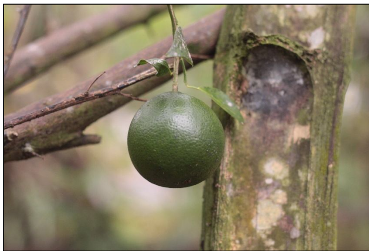
Gambar 10. Gejala infeksi Gummosis.

tidak beraturan pada daun, daun kecil, pucat, mengalami penebalan, tulang daun menguning, kadang disertai klorosis menyerupai kekurangan Zn, Mn, atau Fe tetapi tidak simetris. Pucuk menguning ( yellow shoot ), pertumbuhan tanaman kerdil atau tidak seragam, cabang mati perlahan ( dieback ) (Nurhadi, 2015). Infeksi pada buah ditunjukkan dengan ukuran buah yang kecil dan bentuk tidak normal (membulat tidak sempurna), biji berwarna gelap, rasa buah pahit dan masam, buah matang tidak merata: satu sisi hijau, sisi lain kuning ( greening ) dan seringkali menyebabkan buah tidak layak konsumsi. Gejala internal tambahan adalah pembuluh floem tampak kecokelatan saat batang atau tangkai buah dibelah, kadang terdapat pengerasan floem ( phloem plugging ) (Kalasyank, 2015).