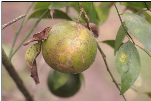
Gambar 12. Gejala infeksi Busuk Buah.

Penyakit Kudis Jeruk ( Citrus Cancer ). Penyakit kudis jeruk atau Citrus Cancer adalah penyakit yang menyerang batang, cabang, dan terkadang buah jeruk, yang ditandai dengan munculnya luka atau kerak tebal berwarna cokelat hingga kehitaman (Endarto & Martini, 2016). Penyakit ini termasuk serius karena dapat mengganggu pertumbuhan tanaman dan menurunkan produksi buah. Kudis jeruk terutama disebabkan oleh bakteri Xanthomonas citri subsp. Citri .