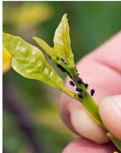
Gambar 1. Imago Toxoptera citricida .

Perilaku makan ( feeding behavior ) T. citricida berbeda tergantung varietas tanaman jeruk demikian juga dengan durasi makan T. citricida , terutama di jaringan floem berbeda antara varietas jeruk. Jeruk lemon menunjukkan akses nutrisi paling tinggi, sedangkan jeruk keprok paling rendah. Artinya, ada varietas jeruk yang lebih disukai T. citricida , sehingga fluktuasi populasi T. citricida pada kebun jeruk juga dipengaruhi oleh faktor lingkungan (jumlah tunas atau daun muda, suhu, kelembaban, curah hujan) serta ketersediaan predator alami. Aphis sp. merujuk pada berbagai spesies kutu daun dari genus Aphis , yang dapat menyerang banyak jenis tanaman tidak hanya jeruk. Warna tubuh bisa bervariasi (hijau, kuning kehijauan, hitam, dsb.), ada yang bersayap ( alatae ) dan ada yang tidak bersayap ( apterae ). Aphis menghisap cairan dari daun, pucuk, atau bagian lunak tanaman, menyebabkan gangguan pertumbuhan seperti daun menguning, menggulung, layu, bahkan gugur jika serangan berat (Foda et al., 2021).