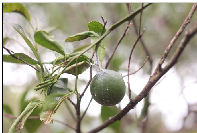
Gambar 11. Gejala infeksi Mati Pucuk. Dokumentasi Pribadi

Penyakit Diplodia Dieback (Mati Pucuk / Busuk Cabang). Diplodia Dieback , dikenal juga sebagai mati pucuk atau busuk cabang, merupakan penyakit yang disebabkan oleh jamur Diplodia natalensis , sering juga dikaitkan dengan Lasiodiplodia theobromae (Dwiastuti, 2016). Penyakit ini umum terjadi pada tanaman jeruk di daerah tropis dan subtropis, terutama pada tanaman yang mengalami stres lingkungan seperti kekeringan, luka mekanis, atau serangan hama. Penyakit ini dapat menurunkan produktivitas tanaman secara signifikan karena menyebabkan kematian ranting, gangguan pembentukan tunas baru, dan penurunan kualitas buah. Penyakit ini disebabkan oleh jamur pathogen. Jamur ini merupakan patogen tular-luka ( wound pathogen ). Infeksi umumnya terjadi melalui luka pada kulit batang atau cabang akibat pemangkasan, gesekan, serangan hama, atau kerusakan akibat kekeringan. Gejala serangan mati pucuk ditunjukkan dengan pucuk tanaman mengering dan berwarna coklat kehitaman, daun pada ranting yang terinfeksi menguning, layu, kemudian rontok, cabang terlihat busuk kering, mulai dari ujung ke arah pangkal. Muncul lekukan memanjang pada permukaan kulit, kulit batang pecah atau mengelupas, terjadi perubahan warna jaringan kayu menjadi coklat gelap atau hitam, getah kadang keluar dari area luka, walaupun tidak sebanyak pada penyakit gummosis (Anggraini et al., 2018).